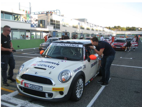
Italia Mini Challenge. Εκκίνηση.

Ειλικρινά δεν είμαι σε θέση να αντιληφθώ, πως μπορούν να υπάρχουν άνθρωποι οποιασδήποτε ειδικότητας, επαγγέλματος, παιδείας, οι οποίοι να υποστηρίζουν ότι στην Ελλάδα του 2014 είναι δυνατή, εφικτή, και συμφέρουσα, για τον τόπο, μια τέτοια κίνηση. Κάπως λιγότερες επιφυλάξεις είχα και για την οργάνωση των 28ων Θερινών Ολυμπιακών αγώνων. Ατυχώς τα οικονομικά αποτελέσματα δικαίωσαν αυτές τις απόψεις και τα βεγγαλικά της Κυρίας που κατέκαυσαν δενδρύλια τινά αλσυλλίου, παρά τω εν Φιλοθέη ανάκτορό, της δεν ήταν παρά η μηδαμινή θυσία.