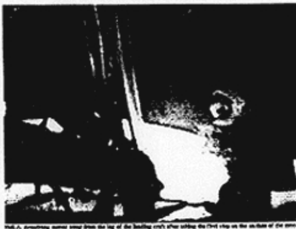
Armstrong, looking down from the top of the landing craft, after taking the first step on the surface of the moon.

EAGLE (to base mission, Houston, Tranquility base here) Eagle has landed. MISSION: Eagle, Tranquility, we say you on the ground. You've got a bunch of guys about to talk back. You're looking good. There's a lot. TRANQUILITY BASE: Thank you. MISSION: You're looking good here. TRANQUILITY BASE: A very smooth touchdown. MISSION: Eagle, you are okay for TE. [The first step is the lunar operation.] Over. TRANQUILITY BASE: Eagle, you're TE. MISSION: Eagle and we are now venting the air. TRANQUILITY BASE: Okay. MISSION: The instrument and sensor readings have been received. MISSION: Columbia, we just landed Tranquility base Eagle at 11:05 AM. I had you for 10 days. COLUMBIA: Yes, I heard the whole thing. MISSION: Well, it's a good thing. COLUMBIA: Fantastic. TRANQUILITY BASE: It's unusual that. MISSION: (CONTINUED) The only major problem was we had to do 10 minutes. That is a 10 minutes 20 seconds after liftoff of your descent. COLUMBIA: (to Houston) (continued) 11:05 AM.