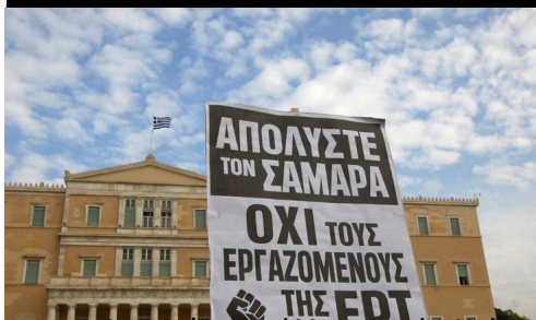
...για να θυμηθούμε και άλλες εποχές. Νοεμβριος '13.