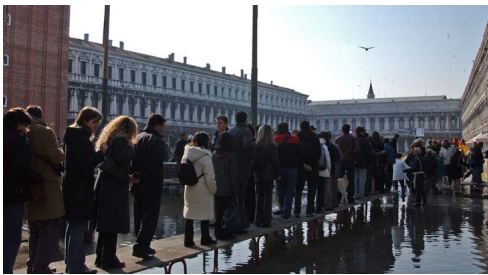
Βενετία. Πλατεία Αγίου Μάρκου. Τέλη Οκτωβρίου του '03.

Ειδικά όταν αποκτά την μαζικότητα μιας βαριάς βιομηχανίας. Είναι αρκετά χρόνια, που το θέμα έχει επισημανθεί και από πολίτες της Βενετίας και της Βαρκελώνης. Δεν μπορεί να υπάρξει αμφιβολία δε, ότι το ίδιο θέμα αντιμετωπίζουν όλοι οι αποκαλούμενοι και δημοφιλείς, προορισμοί. Αυτό που φαίνεται ότι έχει χαθεί είναι το μέτρο, η ισορροπία.