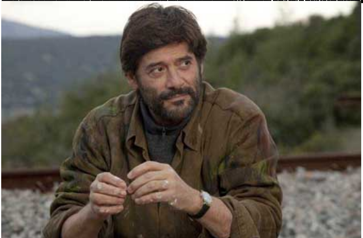
Up in the Air (2009) by Peter Jackson. "George Clooney's 'Up in the Air'." http://www.fox.com/entertainment/up-in-the-air-2009-07-07 . Accessed 19 March 2011.