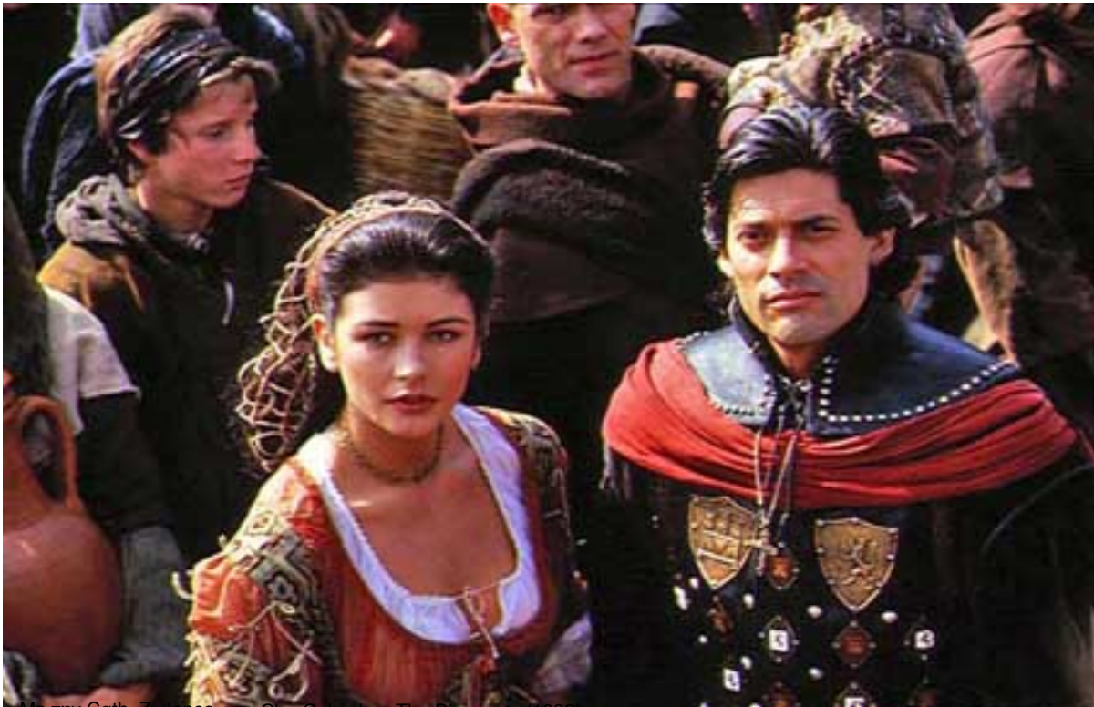
Jim Carrey, Sissy Spacek, Christopher Columbus: The Discovery (1992)