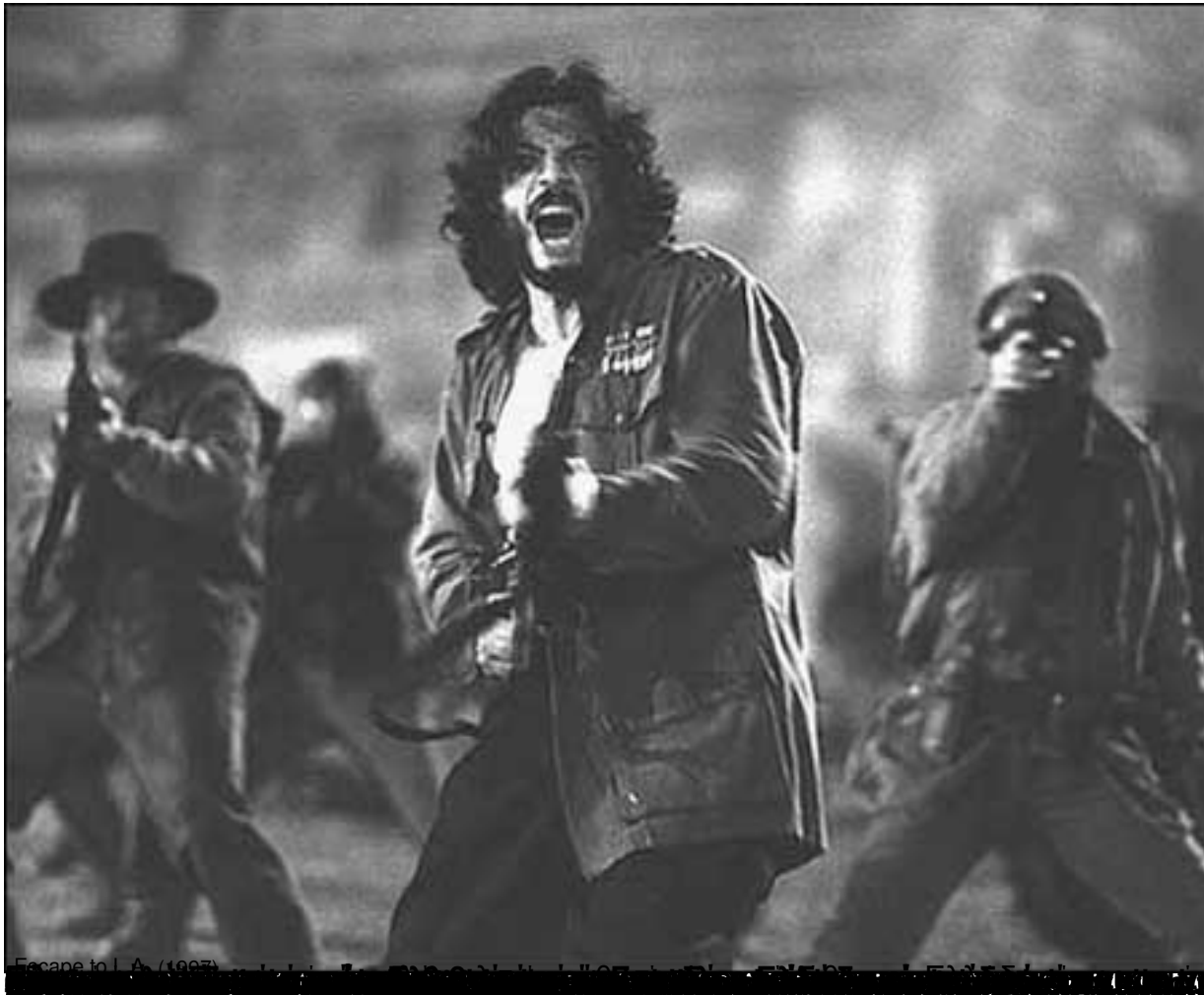
Escape to L.A. (1997) by John Dahl. "The Michael Jackson 'Scream' Video: A Behind-the-Scenes Look at the Making of a Music Video." http://www.fox.com/entertainment/escape-to-la-1997-07-07 . Accessed 19 March 2011.