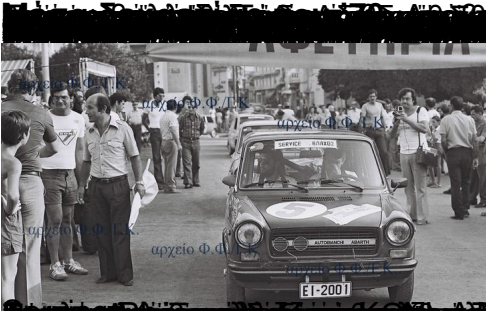
Γράφοτης για σπόγγες «Πολλάς»