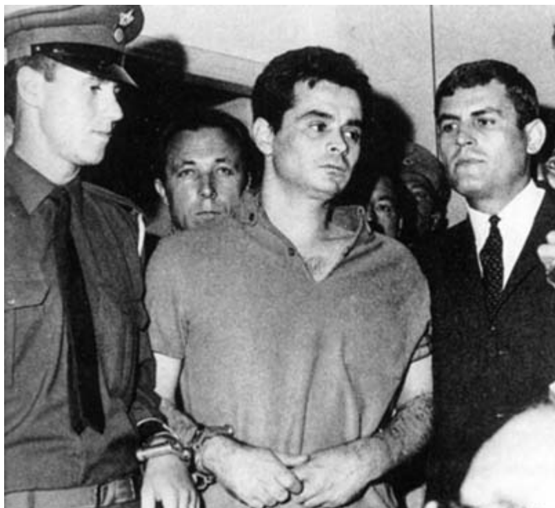
Εισαγωγή στο στρατόπεδο συγκέντρωσης των πολιτικών κρατούμενων, το 1968, στο Γενικό Αρχηγείο της Αστυνομίας.