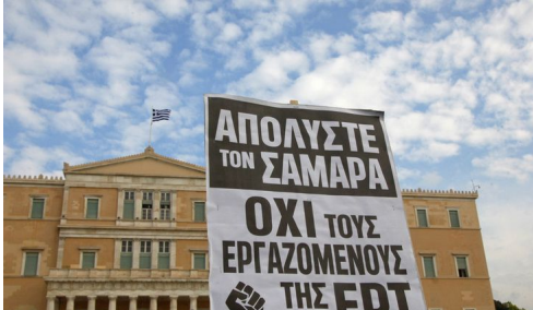
...για να θυμηθούμε και άλλες εποχές. Νοεμβριος '13.