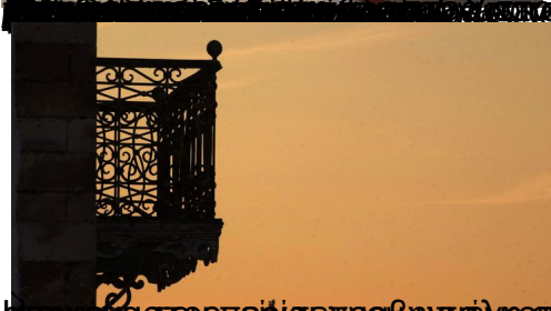
Επιλογή τραγουδιών με θέμα τη χροιά του χρόνου, από τον συγγραφέα και ποιητή Νικόλαο Μανωλάκη, στο βιβλίο «Χροιά του χρόνου», εκδόσεις Καστανιώτη, 2002.