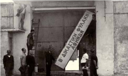
Δεκατέσσερα χρόνια μετά τις εκτελέσεις, το '66, οι φυλακές Καλλιθέας, γκρεμίστηκαν

Οι πρώτες ώρες της 30ης Μαρτίου του '52 – (Τετάρτη 29 Μαρτίου '17)