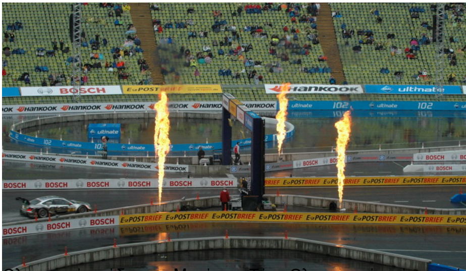
Ολυμπιακό στάδιο του Μονάχου. Τότε Ολυμπιακοί αγώνες, τώρα DTM και X fighters.