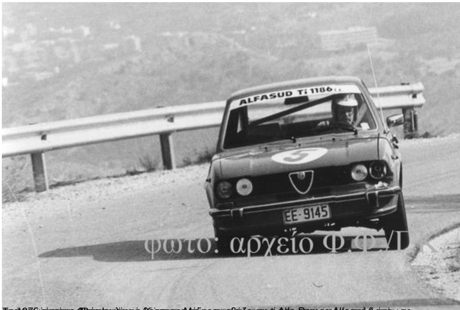
Πριν 1075 χρόνια ο θρύλος του λαγού ο Θεόκλητος Μάλης αναβίπει και η Alfa Romeo Alfa Sud λαγών, το